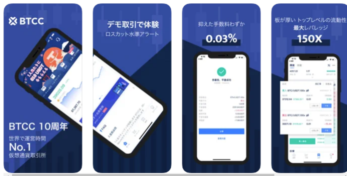
BTCC取引所 App Storeの画面