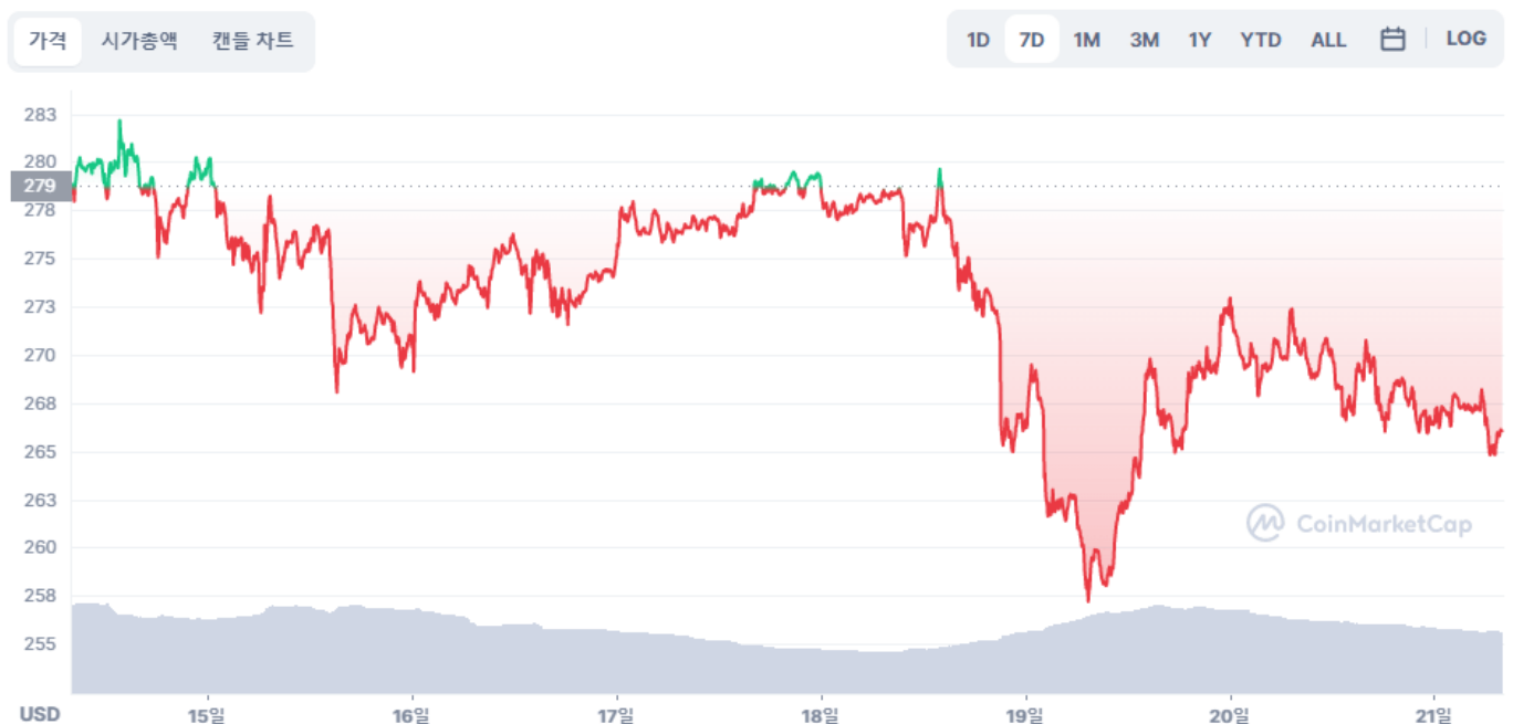
BNB 가격 차트