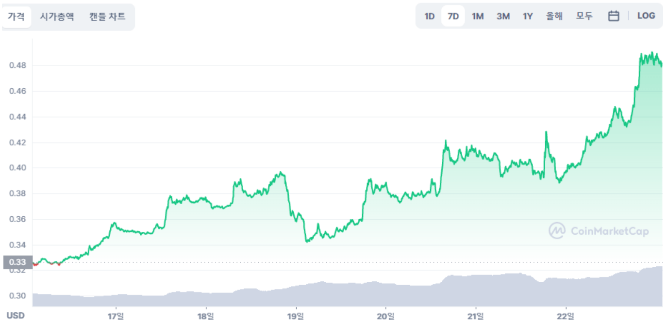
XRP 가격 차트

리플(Ripple)의 고유 토큰 XRP 시세는 한국시간 22일 오전 11시 56분 현재 코인마켓캡 기준 0.4853달러에 거래되고 있다. 이는 24시간 전 대비 21.37% 상승한 가격이다. XRP는 지난 7일간 49.52% 급등했다. 현재 XRP의 시가총액은 약 241억 달러로, 205억 달러 수준인 바이낸스USD(BUSD)와 시총 6위 자리를 놓고 앞치락뒤치락하고 있다.