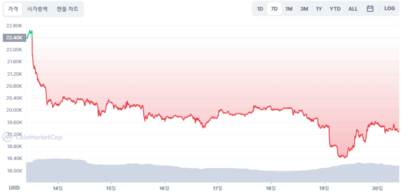
BTC 가격 차트