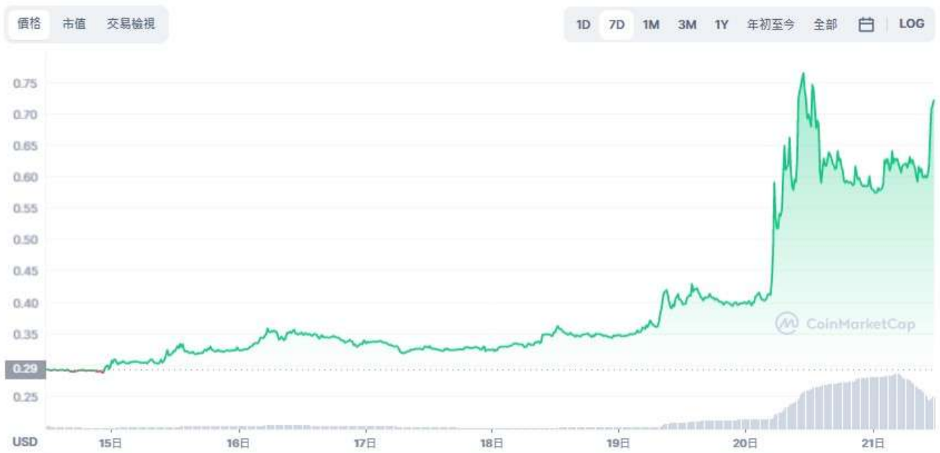
圖表：Stacks 到 USD

在開始投資Stacks (STX) 前，您需要對該加密貨幣項目有一定的認識。下文我們將會對 STX 幣進行詳細的介紹。