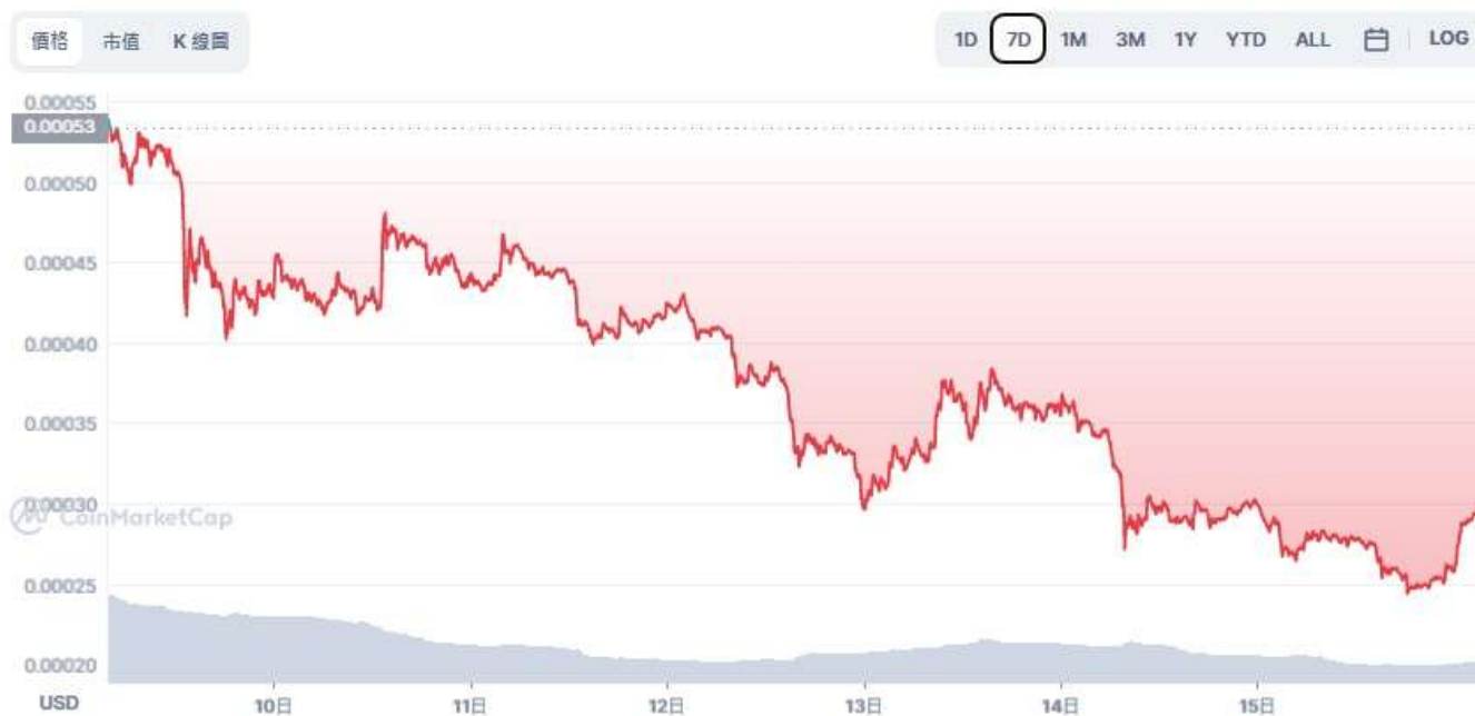
圖表：Terra Classic 到 USD

消息發出後，LUNC 和 LUNA 的價格同時下跌，這兩種硬幣的日線圖大多呈現紅色。截止發稿時，LUNA 的交易價格為 2.85 美元，而 LUNC 的價格為 0.000286 美元。