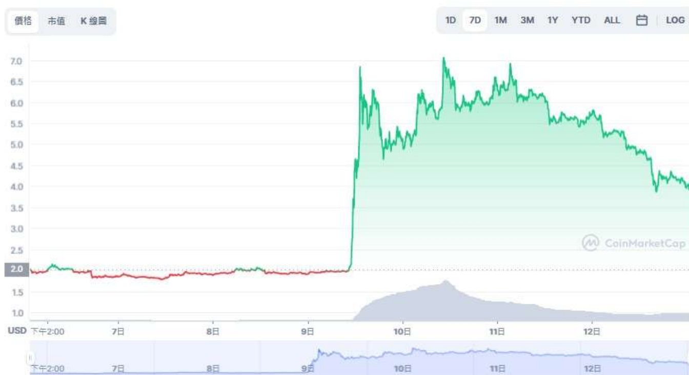
圖表：Terra 到 USD

根據 CoinGecko 的數據，以每枚硬幣 4.18 美元的當前價格計算，LUNA 已從周五的峰值 6.72 美元下跌了 38%。該價格是自 6 月 1 日以來 LUNA 的最高價格，即在第二代硬幣推出後不久，以該價格被空投給了以前的 LUNA 加密貨幣的持有者，原來的 Terra 鏈加密貨幣更名為 LUNA Classic (LUNC)。