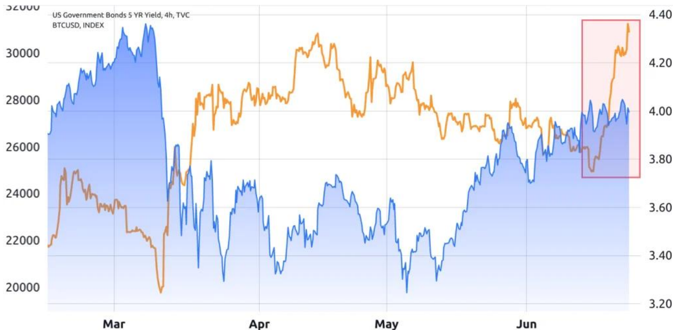
美國 5 年期政府債券收益率與比特幣/美元（橙色）

比特幣與美國國債收益率之間典型的負相關關係在過去10天裡已經失效，很可能是因為投資者為了安全而拼命購買政府債券，儘管收益率低於通脹預期。