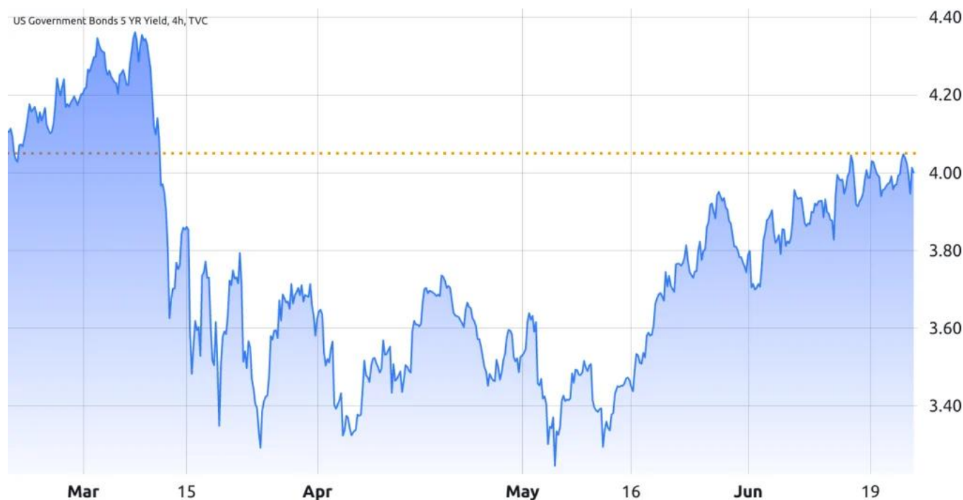
美國5年期政府債券收益率

而美國5年期國債收益率在6月22日達到4.05%，為三個多月以來的最高水平。這一變動發生之際，美國5月份消費者價格指數同比上漲4.0%，這是自2021年3月以來通脹率最低的一次。