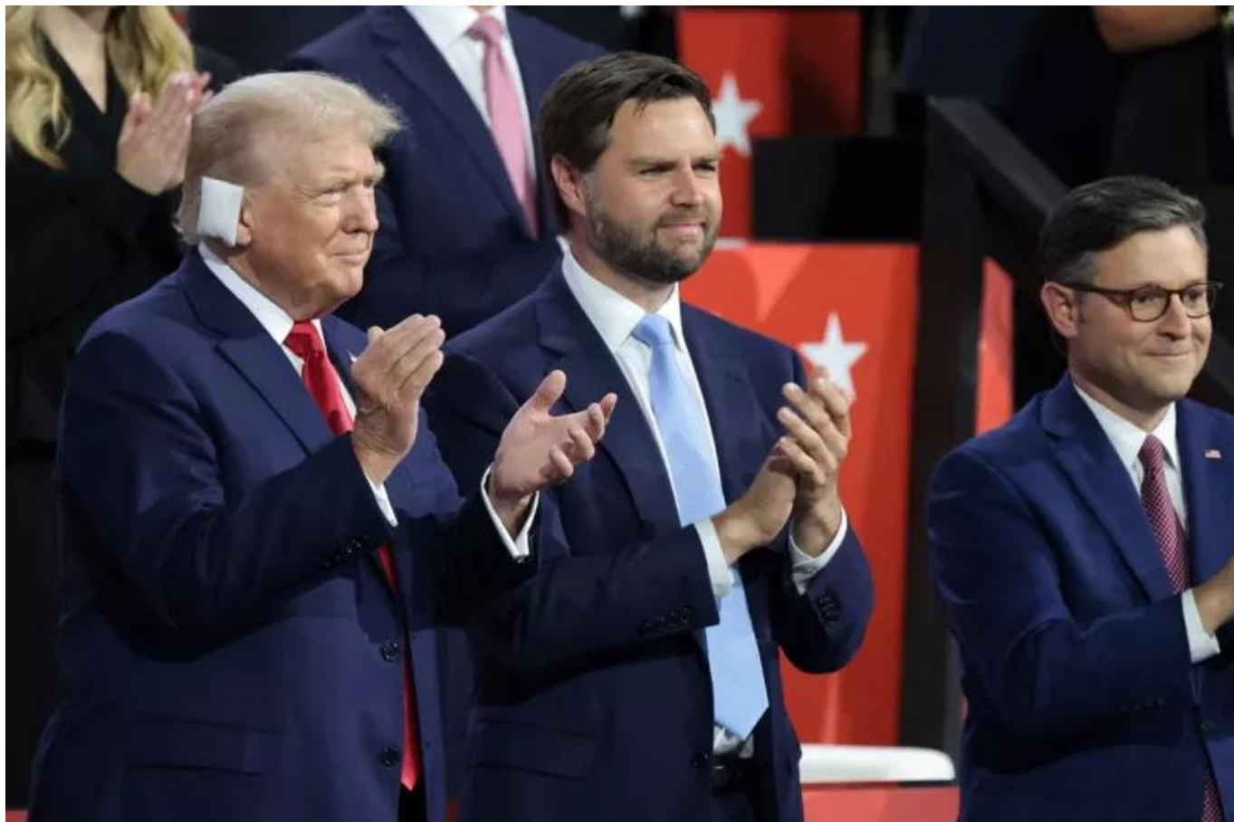
川普出席共和黨全代會

此次川普遇襲讓美國選舉年增添戲劇性，也大大增加了其在今年晚些時候贏得美國總統大選的幾率。