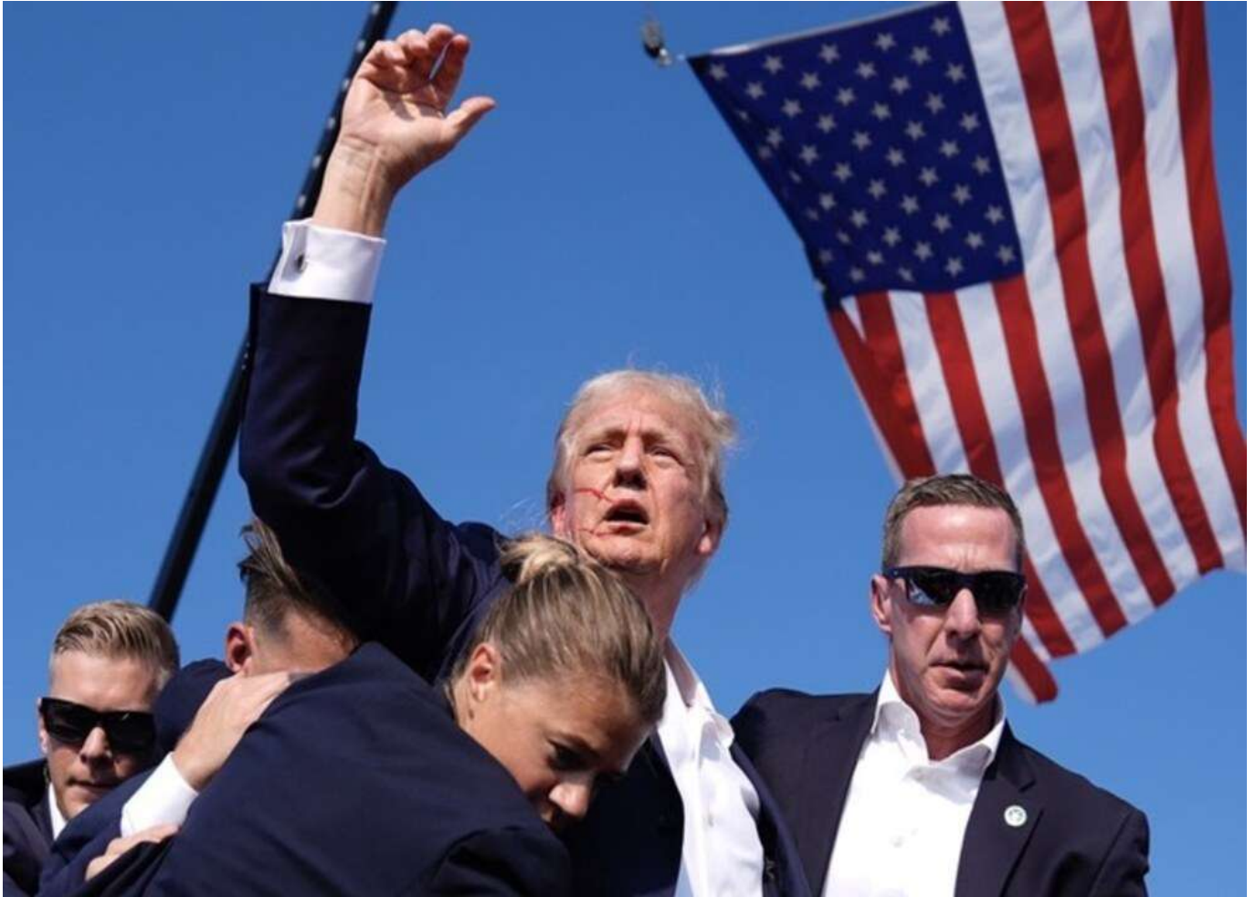
川普遇刺

美國前總統川普（Donald Trump）於美東時間 7 月 13 日在賓州舉行造勢演說時，突然遭到槍擊，在右耳受傷後振臂高呼「戰鬥（fight）」，引發全球關注，一時間有關川普的搜尋量大增。