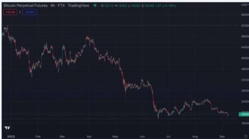
比特幣 2022 走勢