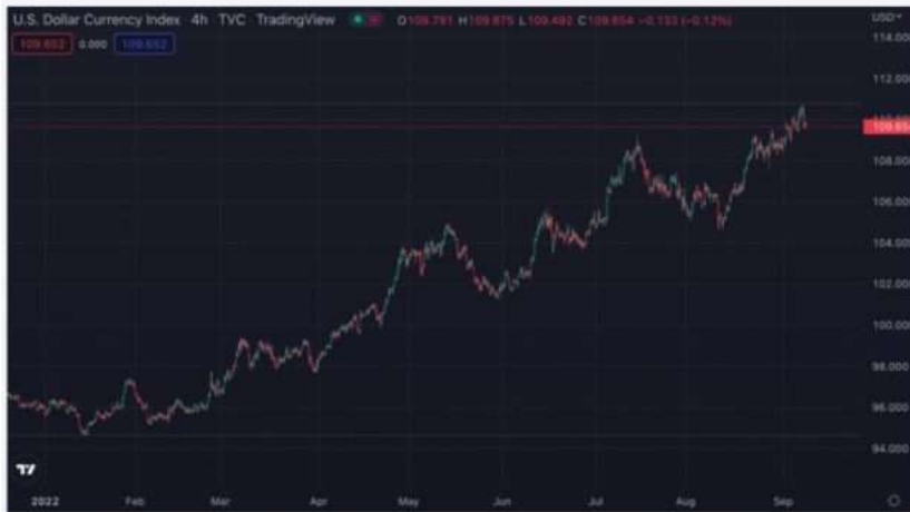
美元指數 2022 走勢

下圖我們以美元指數和比特幣 2022 年的走勢作比較，會發現美元指數今年以來已經上漲了 24% 逼近 110，來到近 20 年來新高；相比之下，比特幣則是下跌了超過 60%。